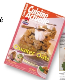
"mini Cuisine Actuelle"