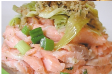
"Crumble de Saumon à l'aneth"