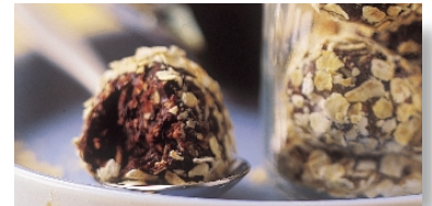
"Truffes fondantes au chocolat"