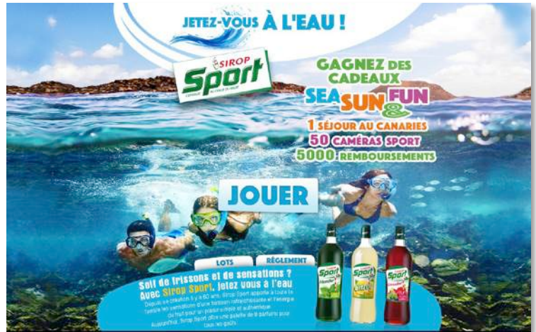
Jetez-vous à l'eau ! Plongée sous-marine et jeu immersif à base de safari photos...

A la clé, la création de sites internet et /ou de jeux immersifs.